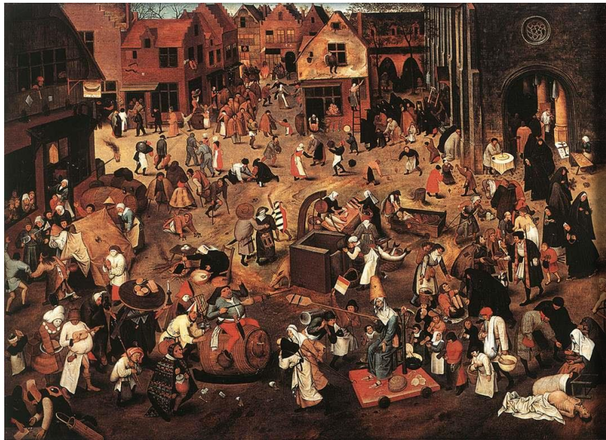
Pieter Bruegel, Flandes, 1559