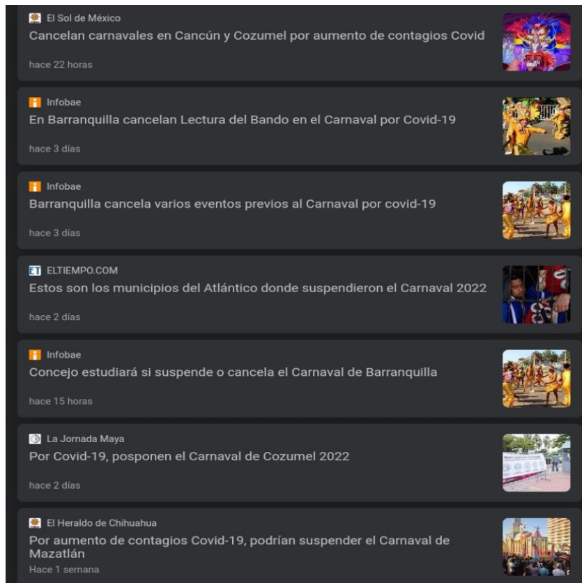
Screenshot tomado de las principales noticias acerca del carnaval 2022