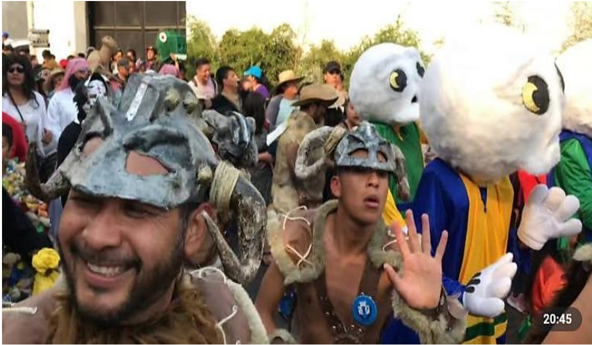
Imagen extraída de video de YouTube del carnaval del 2018