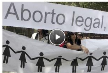
Celebran derecho al aborto en el DF. Un grupo de 80 personas marcharon sobre Paseo de la Reforma con consignas de figuras de mujeres.

Seis de ellas que aseguran abortaron habrían