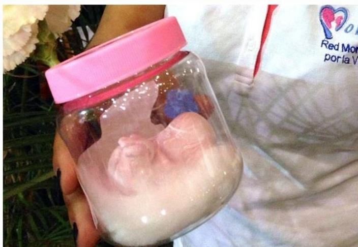
Señala que una de cada cuatro mujeres que abortan en el DF vienen de otros estados a someterse al ILE cuyos costos oscilan en promedio en 55 millones de pesos.