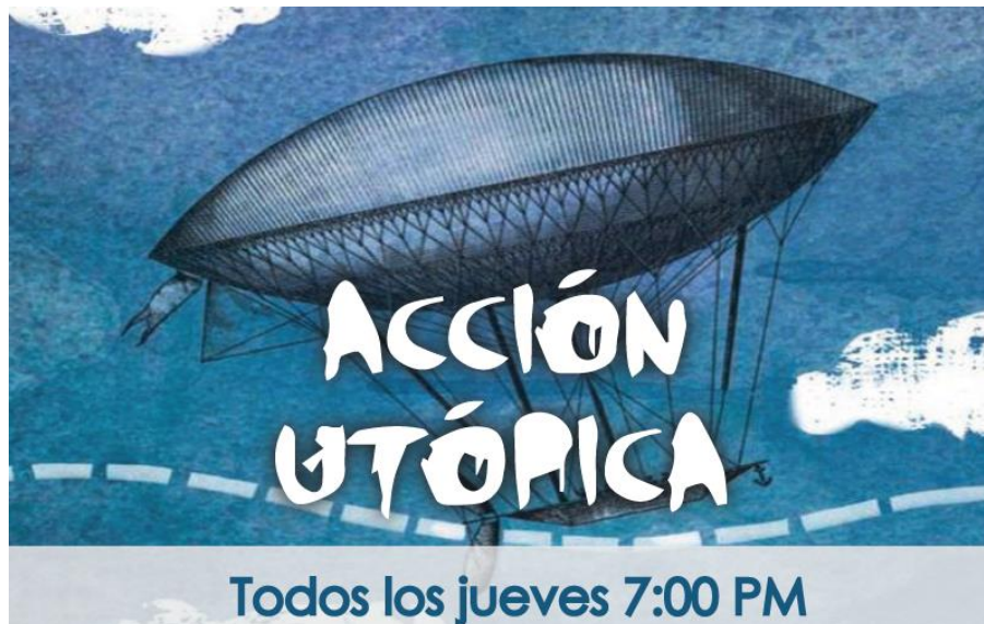
Cartel del programa Acción Utópica

“¿La utopía es un sueño? No. La utopía es posible. Porque creemos que la realidad se puede transformar, te invitamos a escuchar Acción Utópica. Todos los jueves de 6 a 7. Motivados por el sueño de construir una ciudad diferente. Radio Chinelo. Todas las Voces” (Rúbrica del programa Acción Utópica).