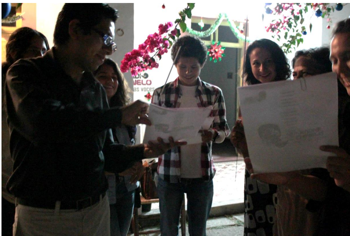
Foto 11: Integrantes de Radio Chinelo en la posada realizada en diciembre 2014

escuela, como ciudadanos, como consumidores y como miembros de Radio Chinelo. En algunas ocasiones, la producción y el sueño de construir la ciudad de un miembro es parecida y se realiza de manera semejante en sus diferentes campos sociales. Pero a veces el colectivo se convierte en un escape de salida para ese individuo, donde las relaciones sociales están en construcción y en camino a la horizontalidad, donde la denuncia no debería reprimirse, donde la expresión de la subjetividad es fundamental y donde el trabajo se desliga de motivaciones y recompensas monetarias personales y se beneficia de aprendizajes. La radio en su conjunto produce una ciudad deseable, una utopía en la práctica.