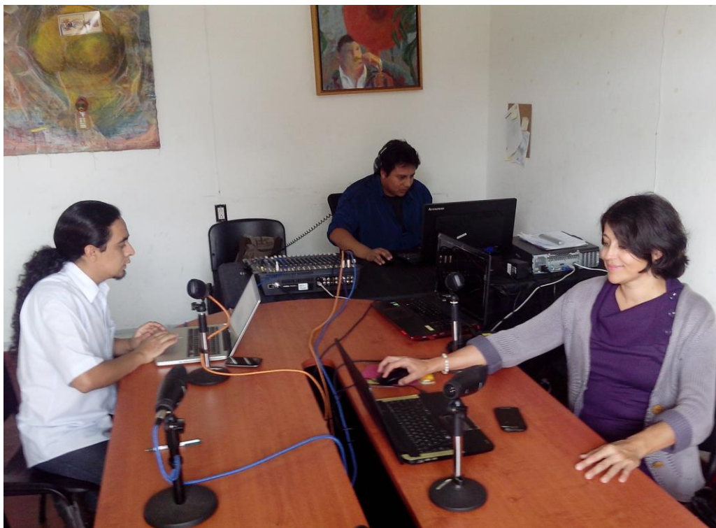
Foto 4. Cabina de Radio Chinelo