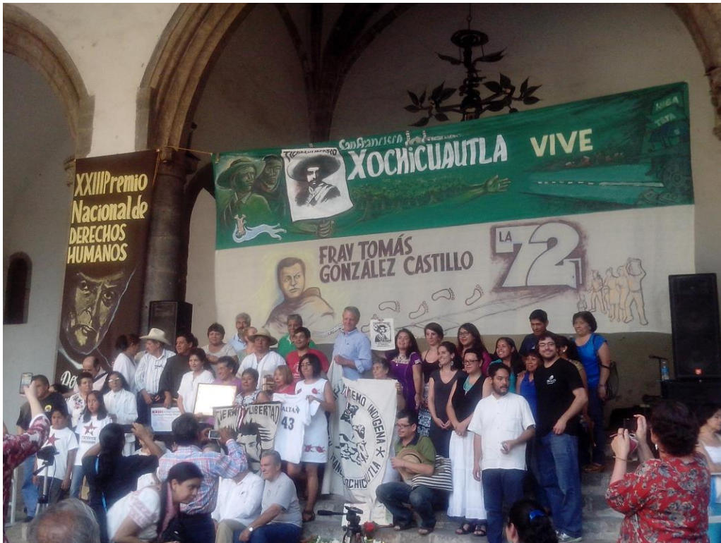
Foto 9: XIII Premio Nacional de Derechos Humanos Don Sergio Méndez Arceo, 2015

el Estado de Morelos fue clave para una mayor articulación del magisterio, los colonos, el campesinado y los obreros. 12