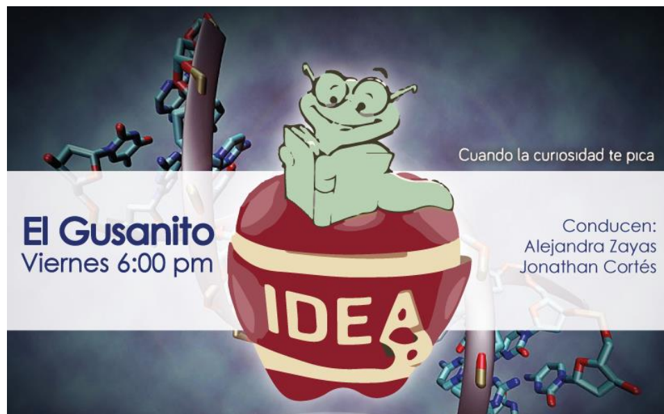
Cártel del programa El Gusanito