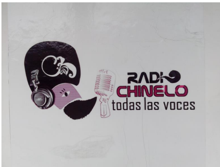
Foto 1. Logo de Radio Chinelo