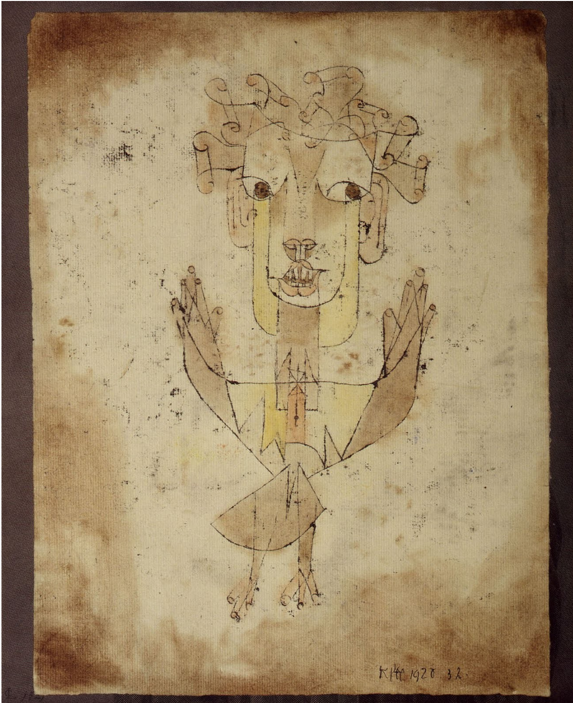
Paul Klee, Angelus Novus, 1920, acuarela, 31,8 x 24,2 cm, Museo de Israel, Jerusalén